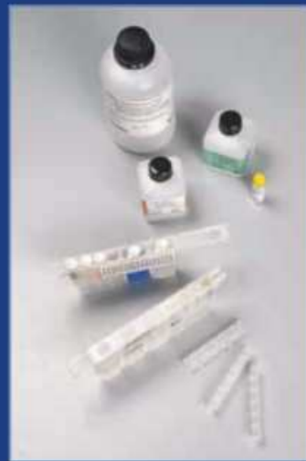
Caseta de test